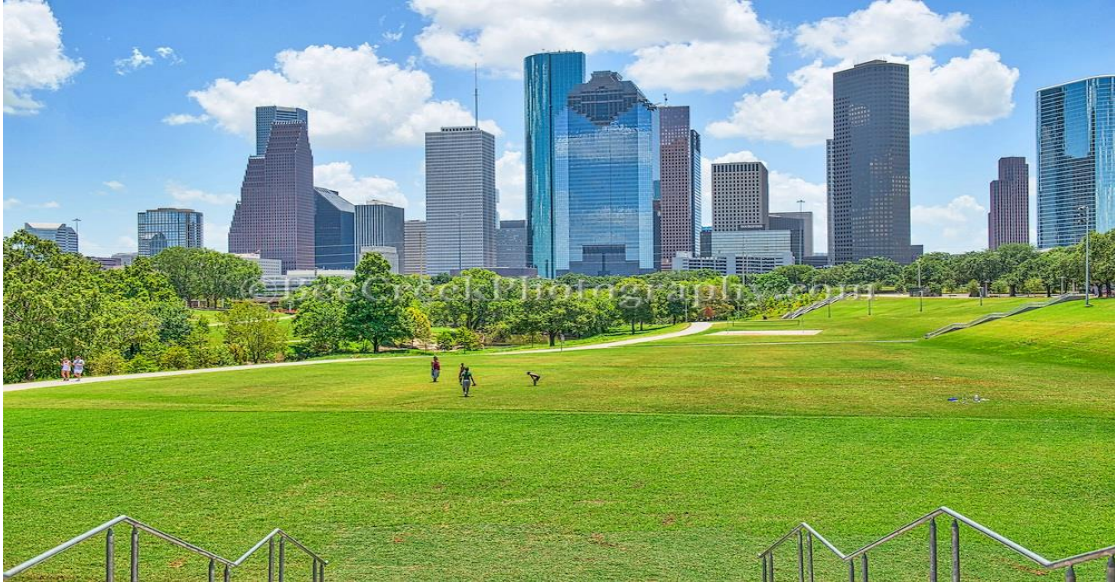
الشكل (10.3) حديقة محلية في المدينة

عادة ما تقوم الحكومة بالتصميم والتشغيل والصيانة، وأحياناً التعاقد مع شركة من القطاع الخاص، وتشمل السمات المشتركة للمتنزهات الملاعب والحدائق والمشى لمسافات طويلة والجري ومسارات اللياقة البدنية أو المسارات والملاعب الرياضية (القيعي، 1985).