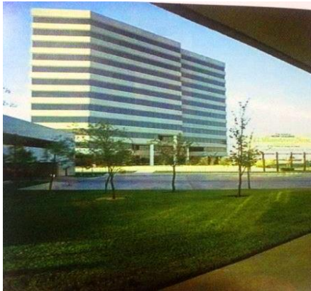
شكل (4.3): حدائق منشأة عامة

مثال السدود و المنشآت الهندسية الاخرى و الغابات و البحيرات أو الجبال، يمكن استعمالها كمناطق للنزهة المكشوفة لا تحيطها أسوار لاتساع مساحتها، تكون بعيدة عن المدينة، هذه الحدائق تتسع لأعداد كبيرة و جماعات متعددة، وتصلح هذه المساحات الواسعة لزراعة أشجار الغابات، كما هو مبين في (الشكل 3.3 – 4.3) (داود، 1997).