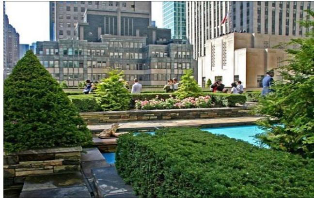
شكل (3.3): حدائق منشأة عامة

( http://www.finegardening.com , accessed on 2017-03-28 )