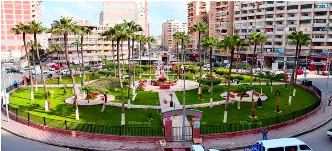
شكل (1.3) حديقة السيوف-ميدان المطافئ .

مثل هذه المتنزهات صغيرة الحجم نظرا لمساحتها المحدودة تصمم هندسية الطراز، تعتمد على المسطحات الخضراء و النباتات المشكلة و المنشآت الاصطناعية كالنوافير و المقاعد و المظلات (مراد، 2003).