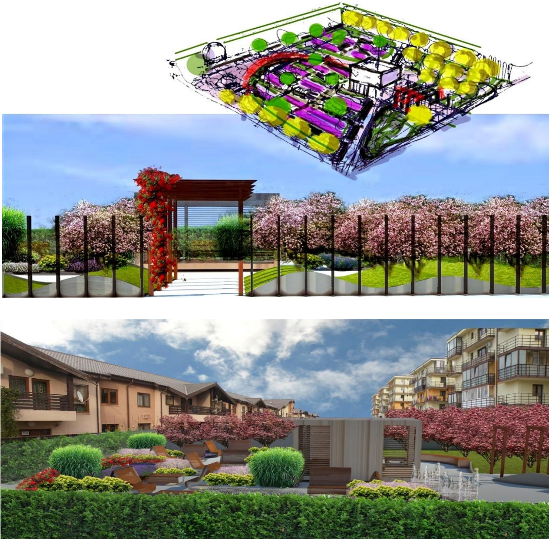
شكل(5.3) : واجهة منظورية لحديقة شبه عامة

( http://landstudio22.blogspot.com/2014/04/gradina-semi-publica-semi-public-garden.htm , accessed on 2017 -03-28 )