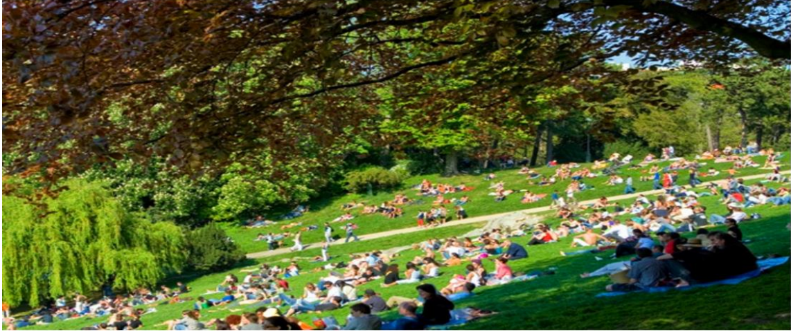
شكل(2.3) بوتييه شومون في باريس-فرنسا

تنشأ الحدائق في الضواحي حيث يتخصص لها مساحات كبيرة تسمح بتنسيقها طبيعياً، ويجد الزائر فيها حرية تامة في التجول و التمتع بمناظر الطبيعة، ويقضي الناس فيها اوقات طويلة لذلك يجب أن تتوفر فيها عوامل الراحة كأماكن الجلوس ومحلات بيع المأكولات أو المطاعم و المرافق ووسائل التسلية المختلفة، ومثال على حدائق خارج المدينة حديقة الشلالات في الاسكندرية وحديقة بوتييه شومون في باريس-فرنسا، (الشكل 2.3) (مراد، 2003).