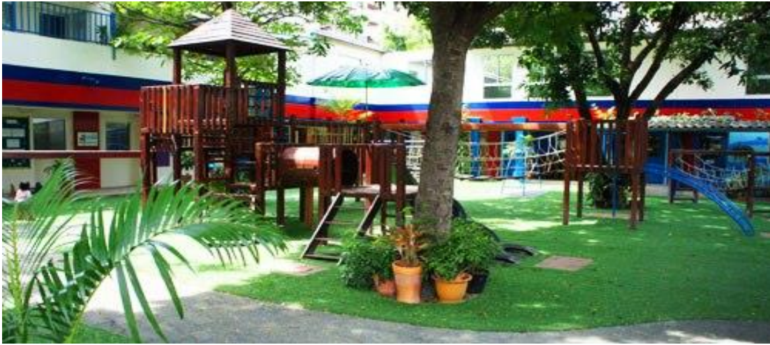
الشكل (7.3) حديقة مدرسية

( http://www.thaigardendesign.com/artificial-grass-playground-area-for-bangkok-school , accessed on 2017-03-28 )