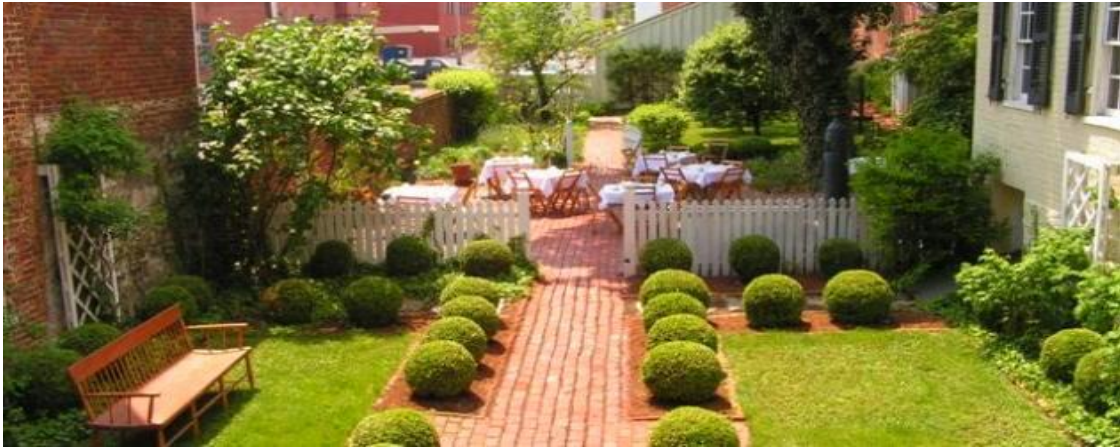
الشكل (6.3) حديقة منزلية

تحتوي الحديقة المنزلية على مساحة واسعة من المسطحات الخضراء، ولها سياج مرتفع نسبياً محيط بها حسب الرغبة، كذلك لغرض التسلية و التمتع بجمال الأزهار و النباتات المختلفة و استنشاق الهواء المنعش، (الشكل 6.3) (المنقور، 1991).