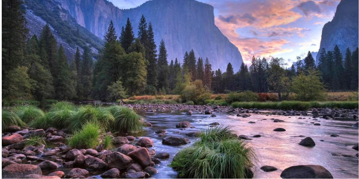
الشكل (11.3) حديقة وطنية

الطبيعية ( 28-03-2017 , accessed on http://www.nationalparks.gov.uk/press/history.htm ) .