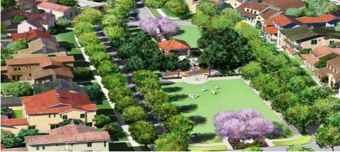
الشكل(9.3) حديقة للأحياء السكنية المجاورة

تشكل مركزاً للترفيه ومرقفا يدعم العديد من أنشطة المتنزه، بما في ذلك الرياضة والأنشطة الترفيهية الأخرى المناسبة للسكان أو المجتمع الذي يستخدم الحديقة، مصممة لخدمة الحي المحيط مباشرة، يخدم متنزه الحي في المقام الأول المقيمين في حوالي 1.6 كم من الحديقة، دون الحواجز المادية أو الاجتماعية إلى الحدود، كذلك سهولة الوصول من الحي المحيط، والموقع المركزي، والربط في الطرق الخضراء، فيجب أن يسمح الموقع نفسه باستخدام النشاطات الترفيهية، فالناس يذهبون إلى الحديقة كمتنفس في الهواء الطلق اللطيف (McDonald, Robert I.; Forman, Richard T. T.; Kareiva, Peter (2010)).